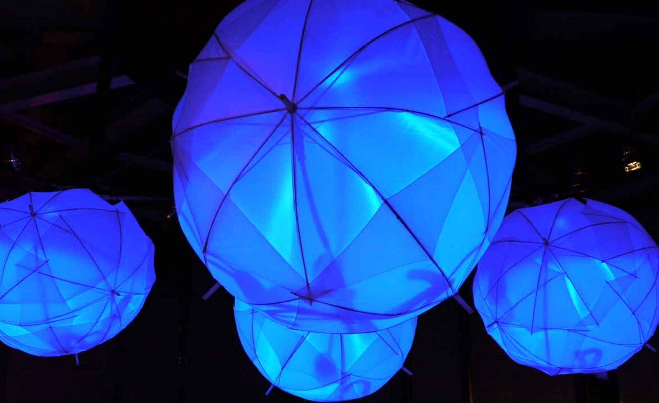
DIE SCHIRMLAMPE PARAPLUMIERE UMBRELLIGHT LEGENRICHTSCHIRM PARAPLUIKNÖDL